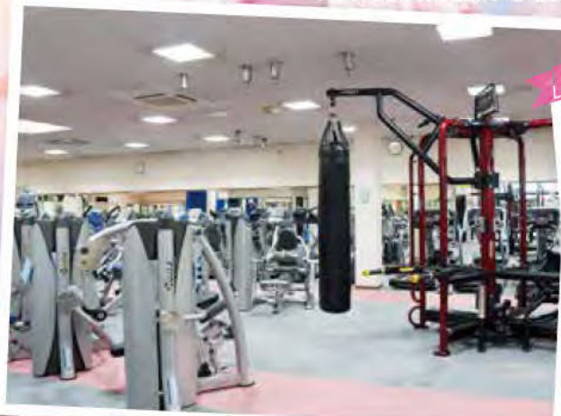
マシンリニューアル