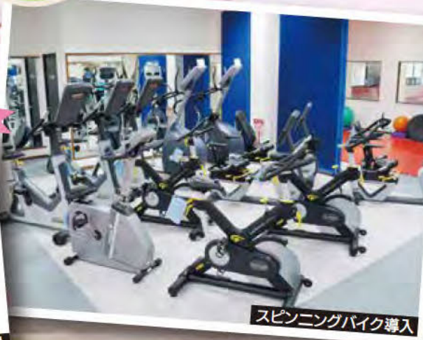
スピニングバイク導入